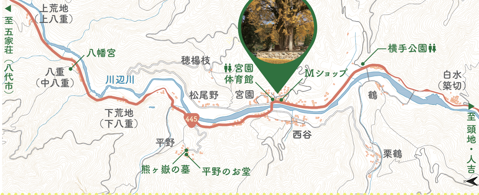
宮園の大イチョウ

五木村中心部（頭地）の北側に位置する地域です。県指定天然記念物の「大イチョウ」があり、現在でも静かな田園風景が残る地域です。